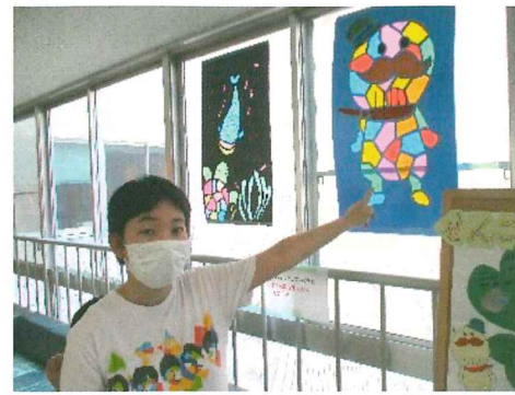
つげさんは、窓ガラスに展示。とてもキレイでした☆