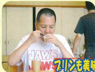
プリンも美味しい!