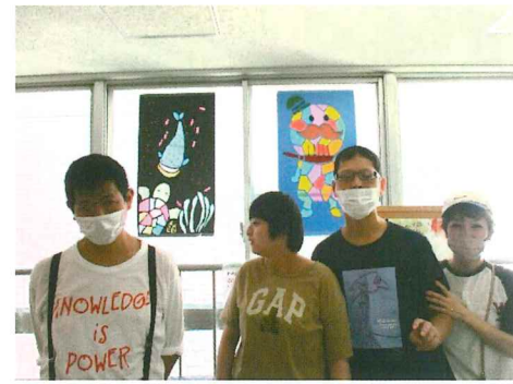
つげさんとクジラの作品の前で仲間と記念撮影。