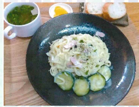
[クリームソースのとってもとってもやさしい味わいです]