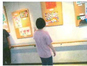
作品は、力作揃いでした。