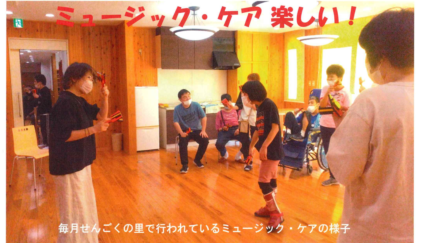
毎月せんごくの里で行われているミュージック・ケアの様子