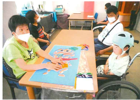
只今製作中。つげさんの枠に色々なフィルムを貼り付けています。

せんごくの里では、貝塚市中央公民館で開催のにっこり展へ毎年作品を出品しています。今年も、貝塚市のイメージキャラクターである、つげさんのステンドグラスを作って出品し、仲間と見学へ行きました。