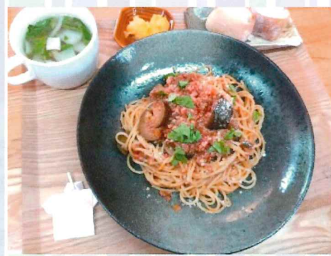
[ミートソースとひき肉のうま味が幸せなハーモニーを奏でます]