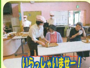
いらっしゃいませー!